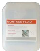
5 Liter Kanister